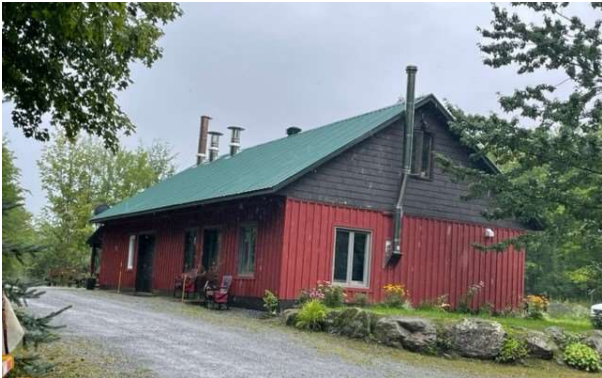
Photo – Cabane à sucre