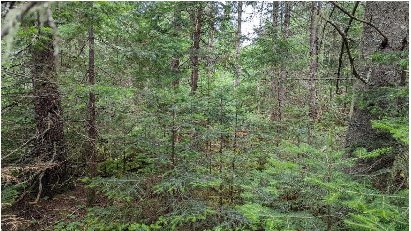
PHOTOGRAPHIE 2 : MILIEU FORESTIER SUR STATION TERRESTRE, DOMINÉ PAR LES CONIFÈRES