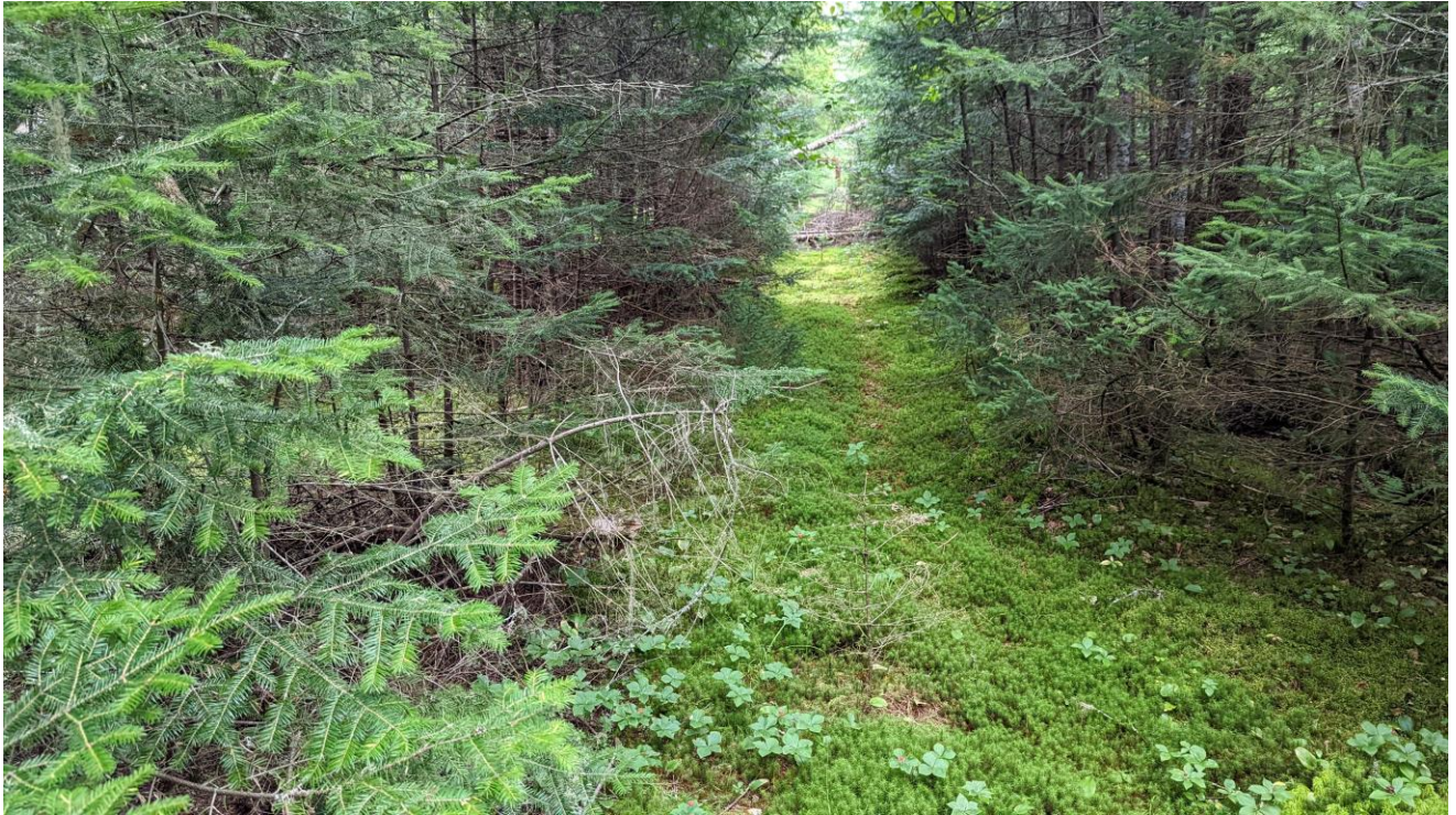
PHOTOGRAPHIE 1 : SENTIER PRÈS DE LA LIMITE SUD-EST DU LOT