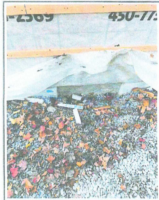
Identification : Sortie des égouts