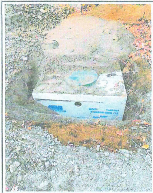
Identification : Fosse de rétention